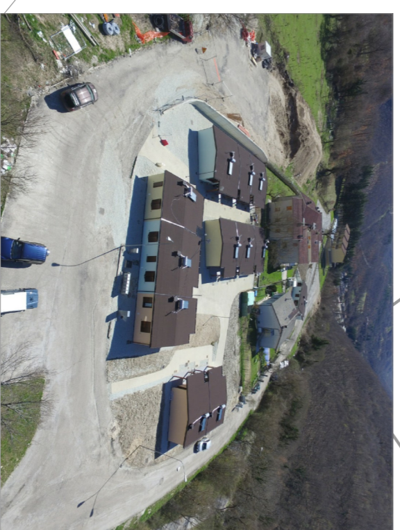
Foto aerea area S.A.E. Nocera. Rif. Sito Protezione Civile Regionale

Area 5 Nocera n. 12 S.A.E. n. 24 residenti di cui n. 2 con disabilità