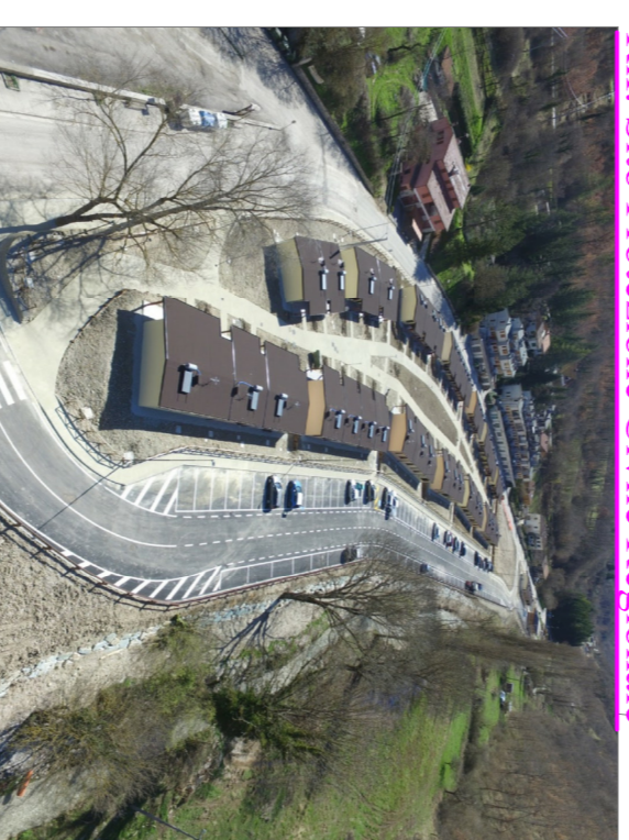
Foto aerea area S.A.E. Capoluogo. Rif. Sito Protezione Civile Regionale

Attuale area camper dove è possibile installare tendopoli