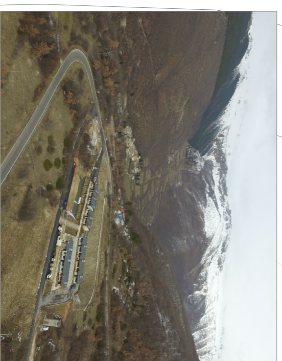
Foto aerea area S.A.E. Gualdo. Rif. Sito Protezione Civile Regionale

Arree di ammassamento: S.A.E. e sala polifunzionale (in fase di realizzazione)