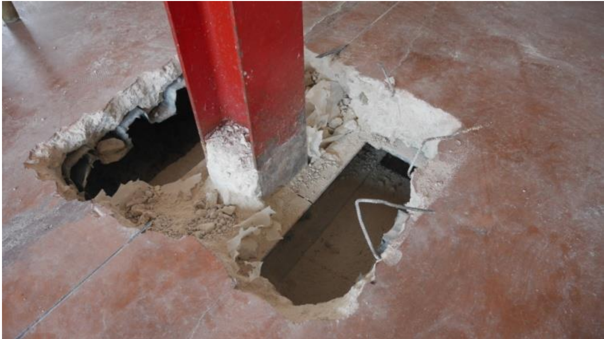
Foto 11 – Particolare collegamento a quota pavimento degli HEA 140 con travi UPN 140