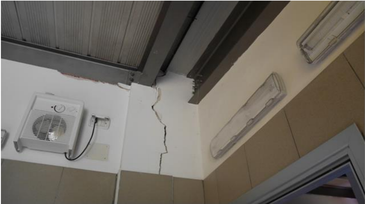
Foto 7 – Collegamento tra “Edificio A” e “Edificio B” Quadro fessurativo in prossimità di ciò che dovrebbe essere un giunto (A sinistra “Edificio A”)