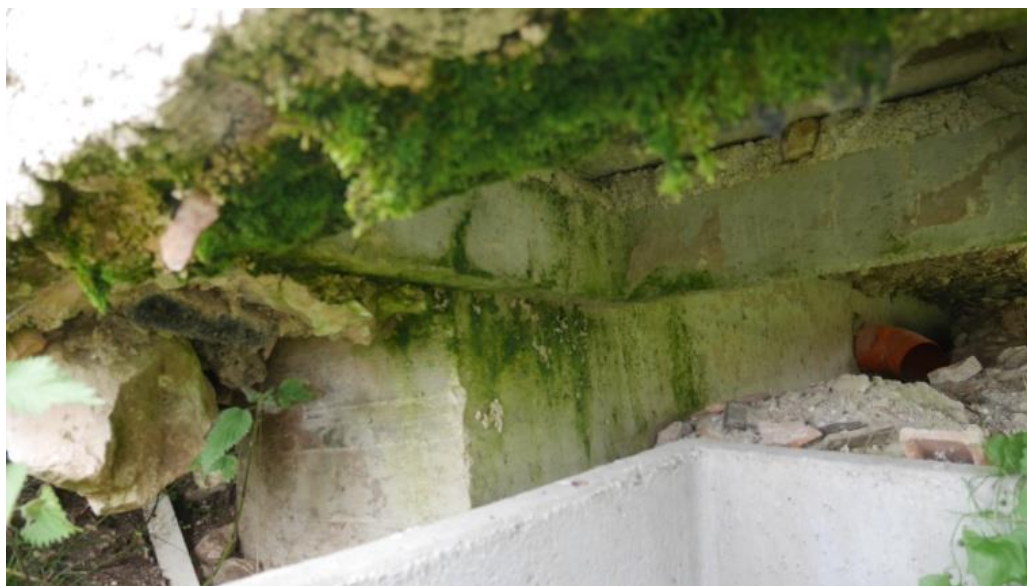
Foto 16 – Trave in calcestruzzo armato di fondazione ed evidente abbassamento del riporto costituente la base fondale e la scarpata Nord-Ovest