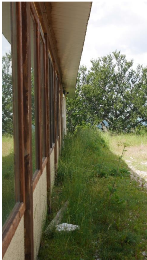
Foto 12 Inclinazione della parete Nord