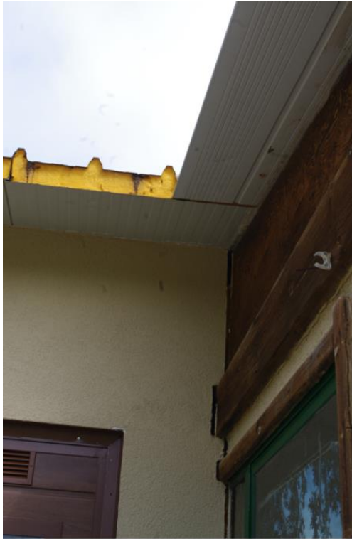
Foto 5 Collegamento tra “Edificio A” e “Edificio B” Quadro fessurativo coerente con i cedimenti differenziali del lato Nord-Ovest