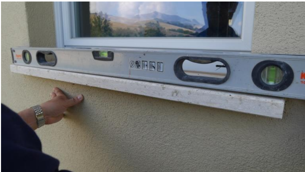
Foto 14 – Inclinazione del fabbricato con rotazione verso valle ( \Delta H = 0,0045 L )