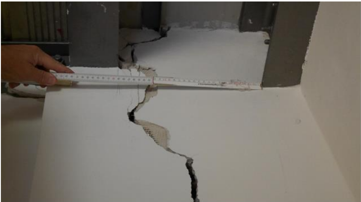
Foto 8 – Collegamento tra “Edificio A” e “Edificio B” Quadro fessurativo in prossimità di ciò che dovrebbe essere un giunto (A sinistra “Edificio A” Particolare)