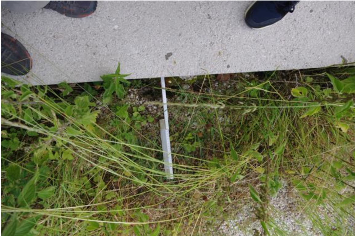
Foto 3 – Particolare della entità dei fenomeni di cedimenti differenziali angolo Nord-Ovest