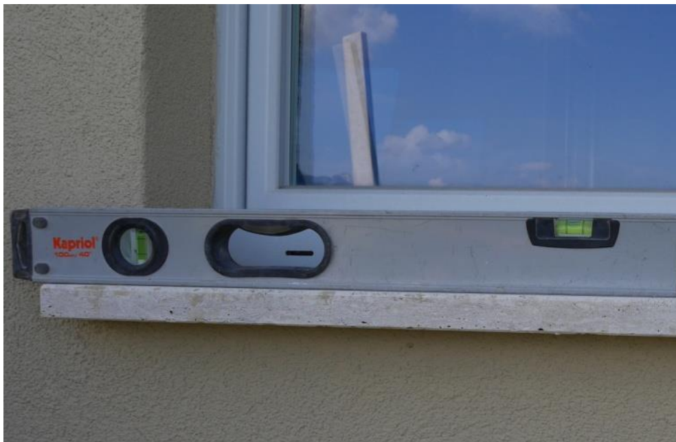
Foto 15 – Inclinazione del fabbricato con rotazione verso valle ( \Delta H = 0,0045 L ) Particolare bolla livella