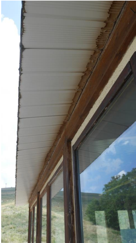
Foto 13 Spostamento tra parete Nord (verso l'interno) e pannello di copertura