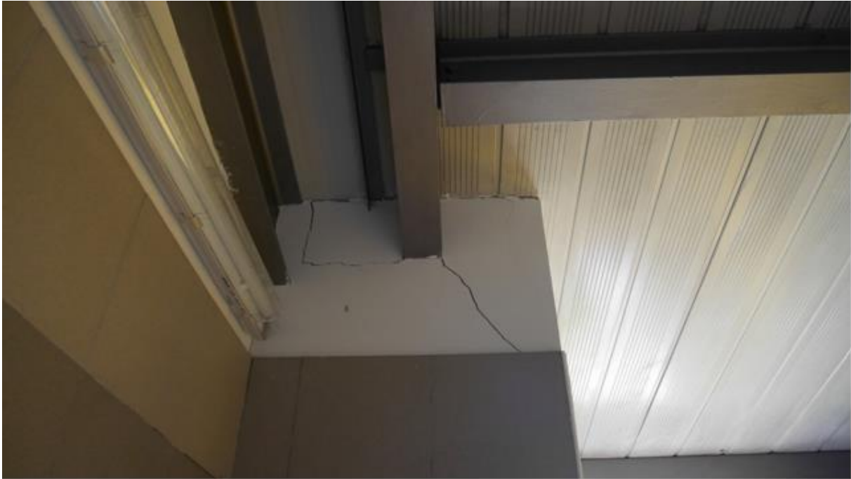
Foto 9 – Collegamento tra “Edificio A” e “Edificio B” Quadro fessurativo in prossimità di ciò che dovrebbe essere un giunto (A destra “Edificio A”)