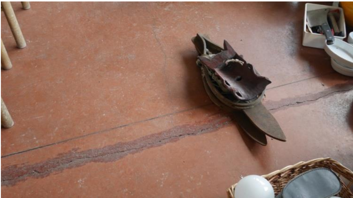
Foto 10 – Riapertura delle filature in corrispondenza delle travi UPN di collegamento dei plinti di fondazione