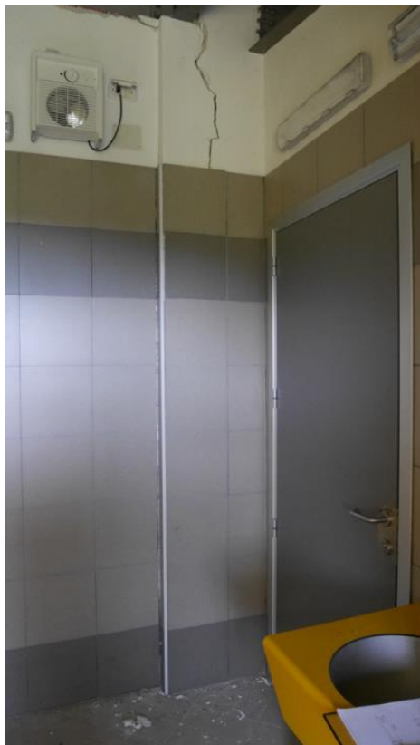
Foto 6 Collegamento tra “Edificio A” e “Edificio B” Quadro fessurativo in prossimità di ciò che dovrebbe essere un giunto - (A sinistra “Edificio A”)