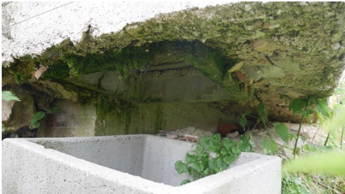
Foto 4 – Particolare della consistenza dei fenomeni di cedimento angolo Nord-Ovest